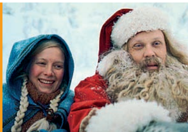
Święty Mikołaj. Sekretna historia reż. J. Wuolijoki Finlandia 2008, 80'

Każde zagadnienie omawiane w trakcie prelekcji multimedialnej może być dodatkowo pogłębione na zajęciach szkolnych. Służą do tego opracowane specjalnie na potrzeby projektu materiały dydaktyczne.