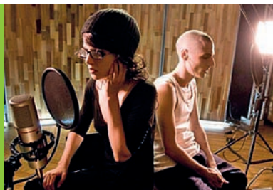
Tlen reż. I. Wyrpajew Rosja 2009, 75'

Każde zagadnienie omawiane w trakcie prelekcji multimedialnej może być dodatkowo pogłębione na zajęciach szkolnych. Służą do tego opracowane specjalnie na potrzeby projektu materiały dydaktyczne.