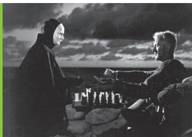
Siódma pieczęć reż. I. Bergman Szwecja 1956, 96'

Każde zagadnienie omawiane w trakcie prelekcji multimedialnej może być dodatkowo pogłębione na zajęciach szkolnych. Służą do tego opracowane specjalnie na potrzeby projektu materiały dydaktyczne.