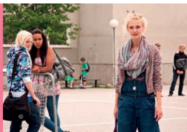
Tysiąc razy silniejsza reż. P. Schildt Szwecja 2010, 85'

Każde zagadnienie omawiane w trakcie prelekcji multimedialnej może być dodatkowo pogłębione na zajęciach szkolnych. Służą do tego opracowane specjalnie na potrzeby projektu materiały dydaktyczne.