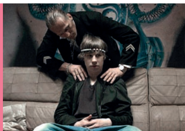
Twardziel reż. D. Buck Niemcy 2006, 99'

Każde zagadnienie omawiane w trakcie prelekcji multimedialnej może być dodatkowo pogłębione na zajęciach szkolnych. Służą do tego opracowane specjalnie na potrzeby projektu materiały dydaktyczne.